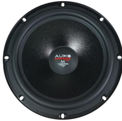
MS 200 EVO